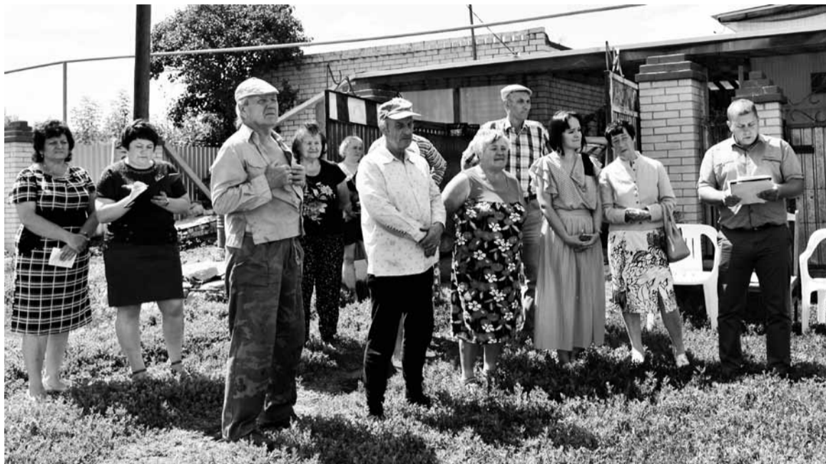
Жители Вязового Гая с улицы Бутырской активно обсуждали будущие преобразования