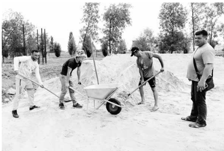
В парке Победы продолжается строительство скейт-парка