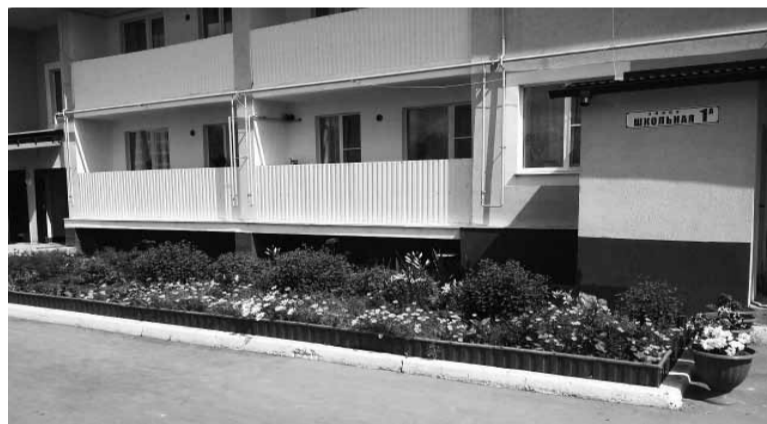
Территория у дома по ул. Школьная, 1 а.

А если придомовая территория возле многоквартирного дома всего лишь небольшой участок земли? Как его обустроить, чтобы и глаз радовало, и уют создавало?