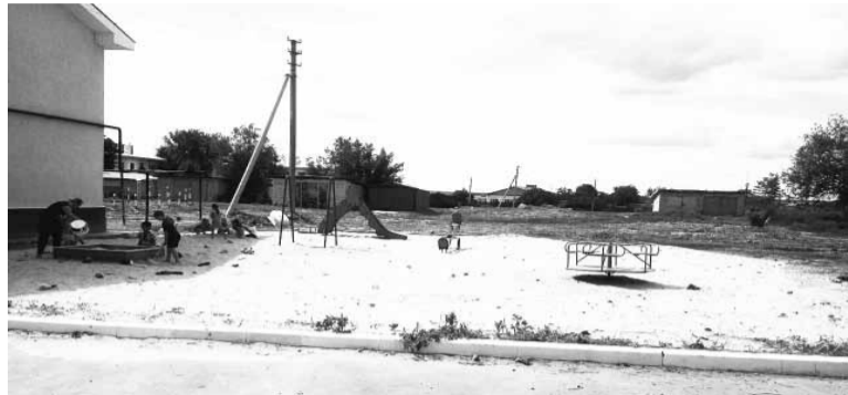
Детская площадка между домами №2 а и №1а по улице Школьная.

Каждый собственник квартиры желает видеть вокруг своего дома уютный двор, ухоженный газон и удобную детскую площадку.