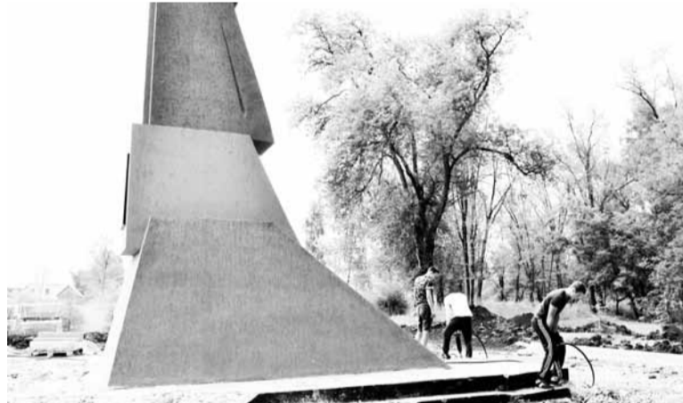
Завершается демонтаж старого асфальта у памятника труженикам тыла в парке Победы

В районном центре продолжаются ремонтные и строительные работы. Бригады подрядной организации ООО «ПаркСтрой» завершили асфальтирование внутридомовых территорий на ул. Мира -11,12,13, пер. Победы - 10 и у дома на ул. Победы, 9. В настоящее время строители обустривают дворы домов по ул. Мира - 27, 29,31, ул. Мира - 42, 44, 46 и пер. Мелиораторов - 12. На улице Ленина, за счёт средств Красноармейского поселения, отфрезеровано дорожное покрытие, а в парке Победы успешно осваиваются средства целевой программы «Формирование комфортной среды». В настоящее время самарская подрядная организация СМТ №9 трудится на двух площадках парковой зоны. На одной возводится скейт-парк, на второй обновляется аллея, прилегающая к памятнику труженикам тыла.