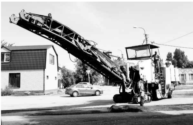
На улице Ленина в селе Красноармейское отфрезеровано асфальтовое покрытие