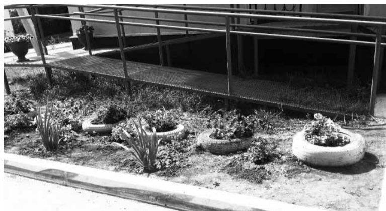
Территория у магазина по ул. Школьная, 2 а