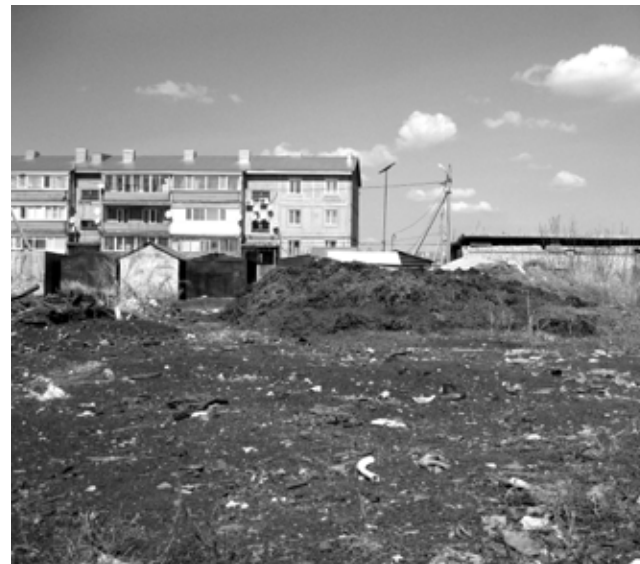
Село Красноармейское, улица Мира (за памятником Ленина).

Уважаемые жители района! Присылайте свои отзывы, мнения, предложения о том, каким вы видите наш район, свое село в плане чистоты и благоустройства и что каждому из нас нужно для этого сделать. Не забывайте: «Чисто не там, где метут, а там, где не сорят».