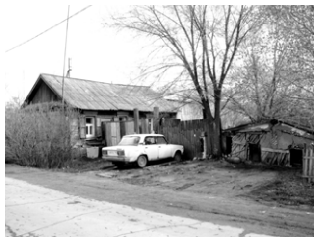
Село Красноармейское, улица Кирова.