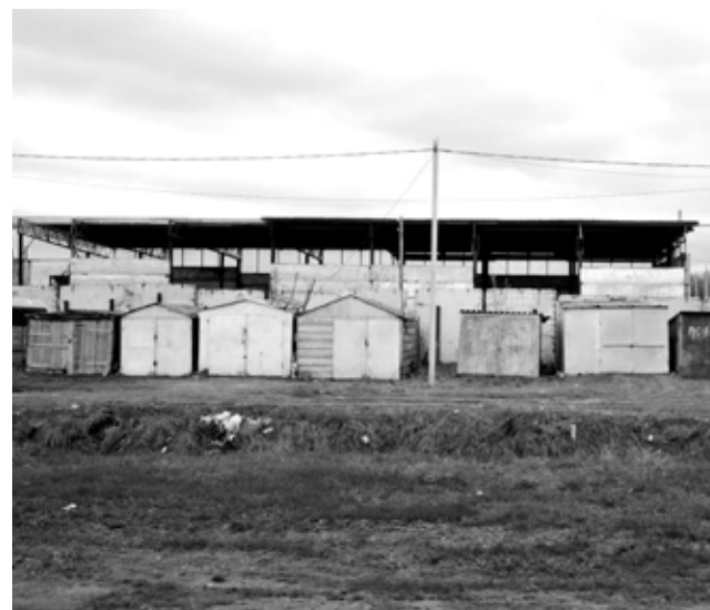
Гаражи в с. Красноармейское, ул. Шоссейная.