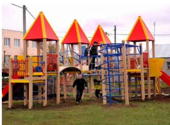
Новая детская площадка в с. Красноармейское.

- Мы вышли на субботник, чтобы навести порядок на улице Чапаева, чтобы наше село было чистое и красивое, чтобы нам приятно было пройти по его улицам. Я помню, как в прежние времена такие субботники организовывались массово, люди работали с задором и большим желанием. Так должно быть и сегодня.