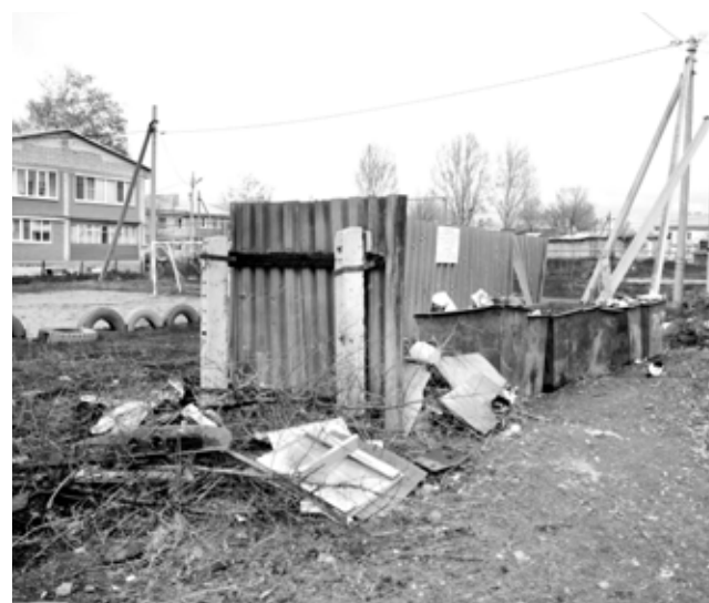
Село Красноармейское, улица Кирова (за магазином «Универсам»).