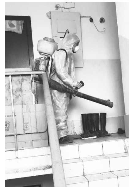
Обработка подъезда жилого дома в с.п. Ленинский