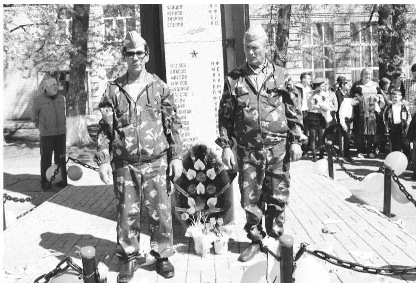
Возложение венков к обелиску Славы в п. Кировский (2018 г.)