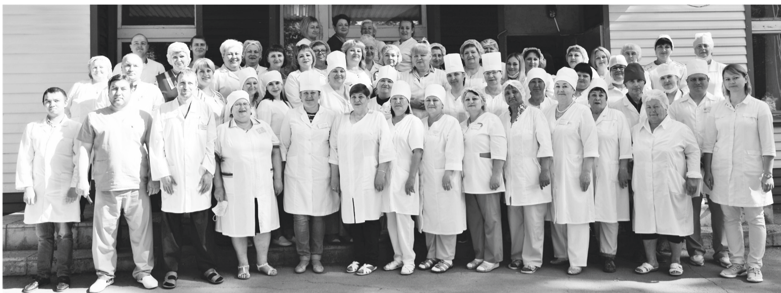
В Центральной районной больнице трудятся преданные медицине люди