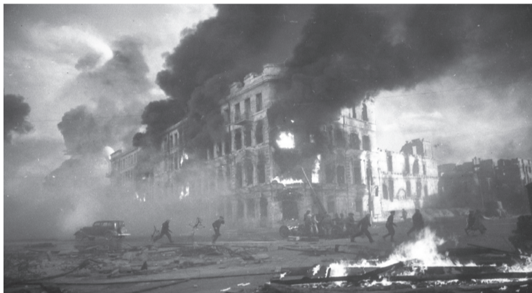
Сталинград в огне

Подготовил М. Киреев. Продолжение читайте в следующих номерах газеты.