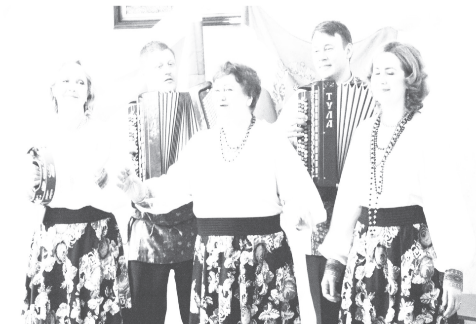
Народный ансамбль русской песни «Воложка»