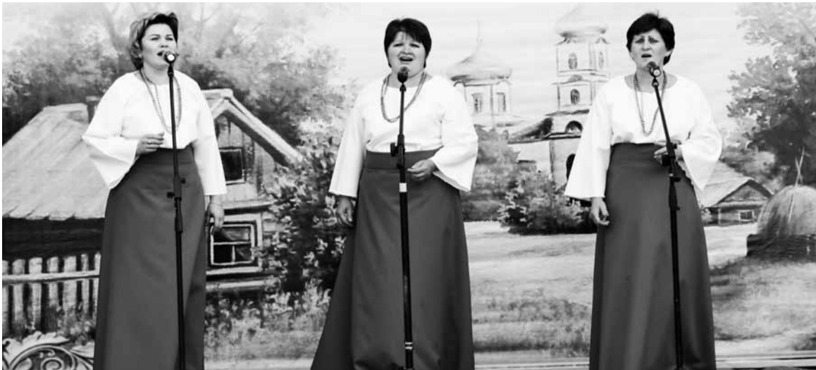
На фото творческий коллектив Дома Культуры посёлка Любицкий в момент выступления