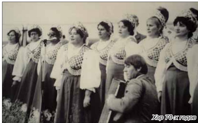
Хор 70-х годов