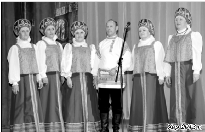
Хор 2013 г.