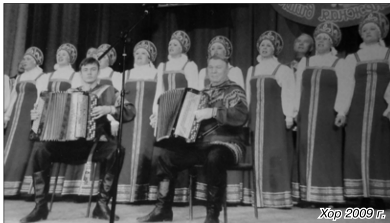
Хор 2009 г.