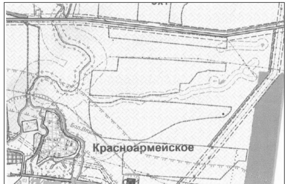
Фрагмент «Карты градостроительного зонирования» до внесения изменений в ПЗЗ

□ - Условные обозначения: - земельный участок (ЗУТ), в пределах которого устанавливаются границы территориальной зоны Т - (Зона транспортной инфраструктуры).