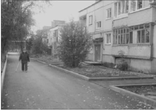
Дворовая территория ул. Кирова - ул. Шоссейная (газовый городок).

Чистые уютные дворики – мечта любого жителя многоквартирного дома. Но не все мы любим заниматься побелкой бордюров, не говоря уже об умении ремонтировать выбоины и трещины в асфальте и т.д. Все эти задачи входят в одно поня-