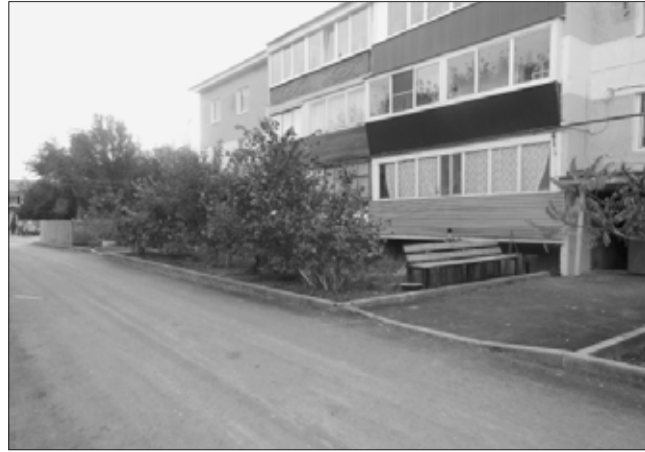
Дворовая территория пер. Мелиораторов, ул. Шоссейная.

по улицам Шовоссейной и Кирова, пер. Мелиораторов после проведения подготовительных работ: демонтаж бордюрно-