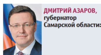
ДМИТРИЙ АЗАРОВ, губернатор Самарской области:

В текущем году будет продолжена и работа по модернизации ДШИ. 12 школ на закупку оборудования получают субсидии, размер каждой из которых составляет 5,5 млн