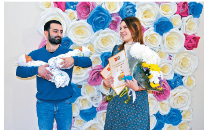
ПО МАТЕРИАЛАМ ГАЗЕТЫ ВОЛЖСКАЯ КОММУНА

В завершение встречи губернатор пригласил министра труда и социальной защиты РФ посетить Самарскую область с рабочим визитом. «Мы надеемся, что в первом полугодии такой визит состоится. Нам есть что показать, в самых разных сферах у нас накоплен большой положительный опыт, которым мы готовы делиться, - резюмировал Дмитрий Азаров. - Мы также договорились о самом плотном взаимодействии на уровне заместителя министра труда и соцзащиты».