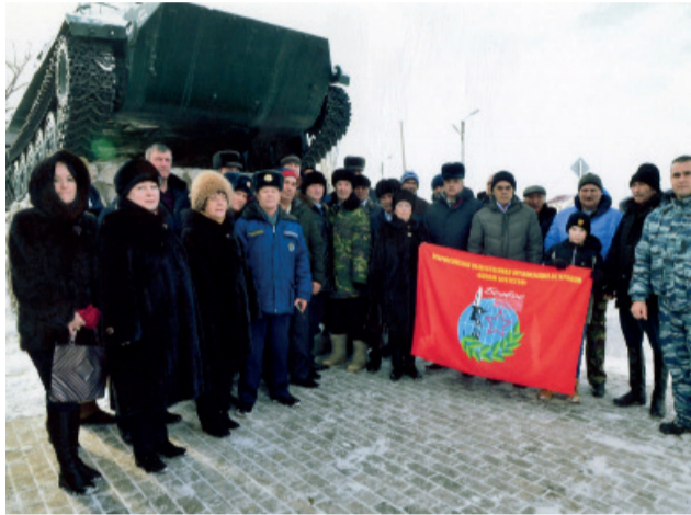
Февраль 2020 года. Возложение венков и цветов