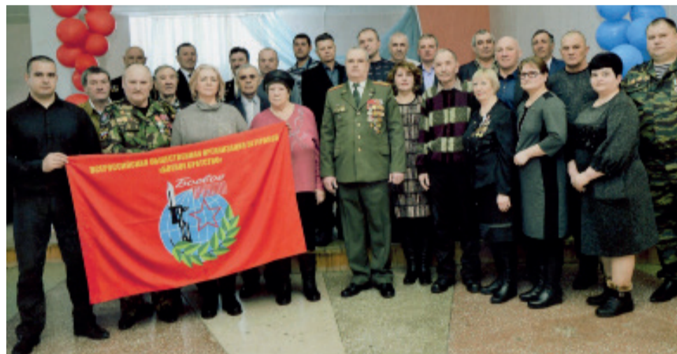
Общее фото воинов-интернационалистов в МКДЦ

третий воин-интернационалист, а это 200 тысяч солдат и офицеров, из которых 1350 женщин, был удостоен высоких государственных наград, медалей и орденов, а 92 из них стали Героями Советского Союза и Российской Федерации. 40-ая армия организовано с развёрнутыми знамёнами вышла из Афганистана сплочённой, боеготовой и закалённой в боях.