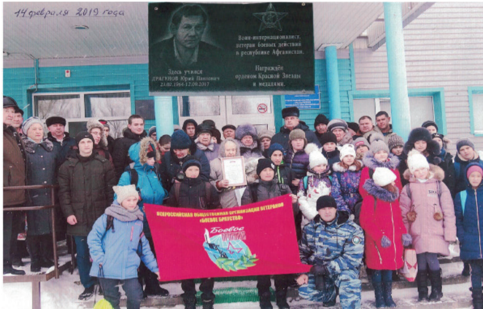
Открытие мемориальной таблички Ю.П. Драгунову у входа в Красноармейскую среднюю школу

В Афганистане около 750 тысяч офицеров, прапорщиков, сержантов и солдат, представляющих все нации и народности СССР, самоотверженно решали возложенные на них задачи. Каждый