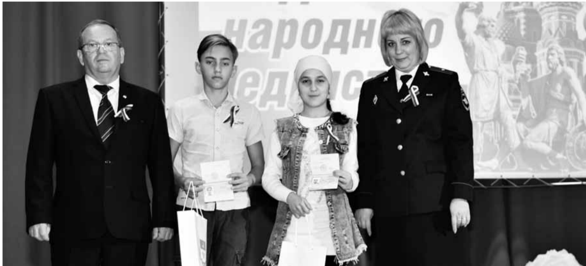
Церемония вручения паспортов школьникам района украсила программу Дня народного единства

День народного единства жители наших сельских поселений отметили по традиции торжественно. В школах прошли тематические акции, в сельских Домах культуры - праздничные концертные программы.