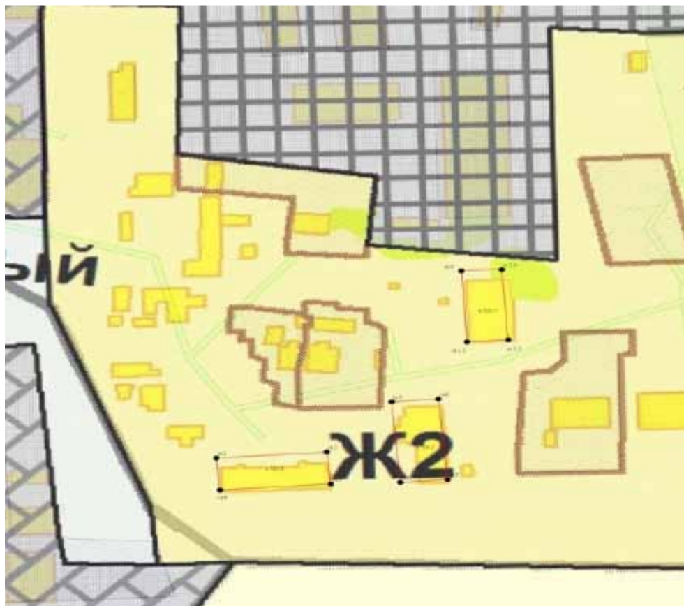
Схема расположения земельных участков на карте градостроительного зонирования квартал 63:25: 0504019 М-2000