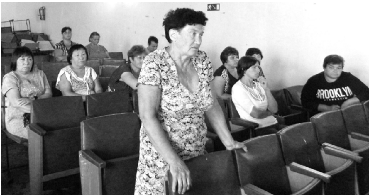
На фото: обсуждение Стратегии развития м.р. Красноармейский в с.п. Гражданский