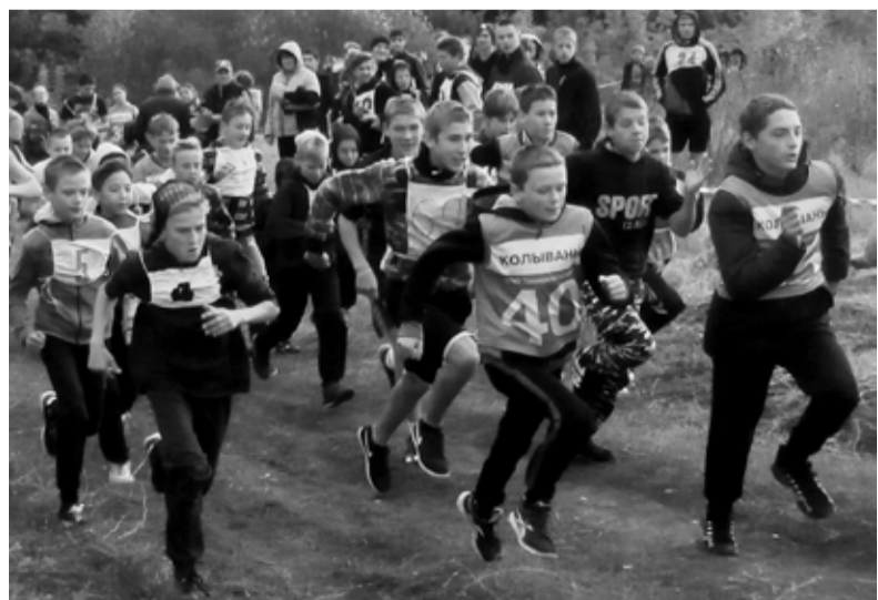
В легкоатлетическом кроссе «Золотая осень-2017» приняли участие свыше 120 учеников из 11 школ района

Подготовили И. Блинова, Е. Сметанина.