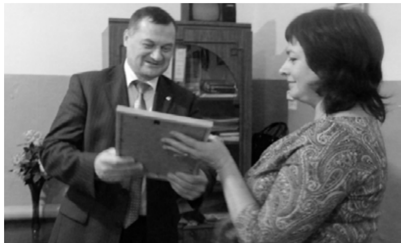
Вручение Благодарственных писем.