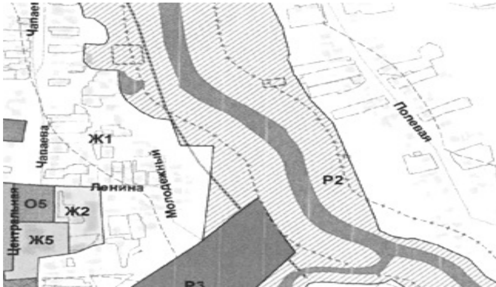
Фрагмент «Карты градостроительного зонирования» по внесению изменений в ПЗЗ

2) Внести изменения в Правила землепользования и застройки в части изменения «Зона естественного природного ландшафта (P2)» и «Зона застройки индивидуальными жилыми домами (Ж1)» на зону «Зона скверов, парков, бульваров, набережных (Р1)» применительно к земельному участку, расположенному в кадастровом квартале: 63:25:0504025 согласно прилагаемой схеме.