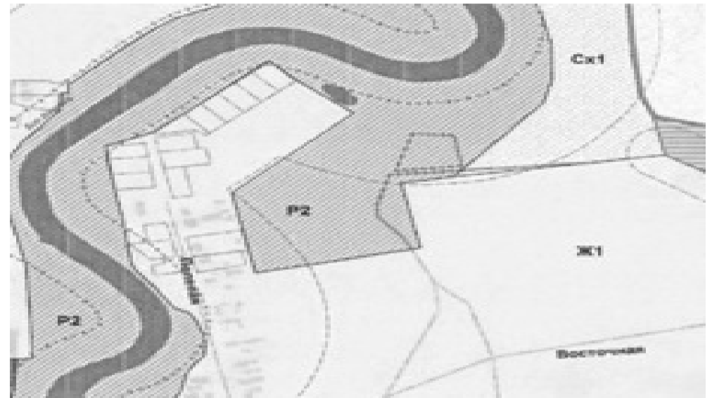
Фрагмент «Карты градостроительного зонирования» по внесению изменений в ПЗЗ