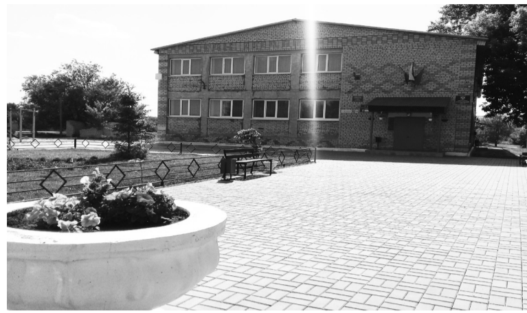
Площадь около ДК в селе Криволучье-Ивановка (ул Центральная)

Идеи по улучшению жизни в городском округе или муниципальном районе могут быть самыми разными: они могут касаться благоустройства дворов, скверов и других территорий, организации водоснабжения, ремонта дорог, сбора отходов, освещения улиц, установки детских площадок, спортивных и культурных объектов. Всего того, что волнует самих жителей. На собраниях граждан рассматриваются не только целесообразность и своевременность предлагаемого проекта, но и определяется объём его финансирования самим населением (физическими и юридическими лицами города или района). Таким образом, стоимость проекта складывается из пожертвований граждан и органи-