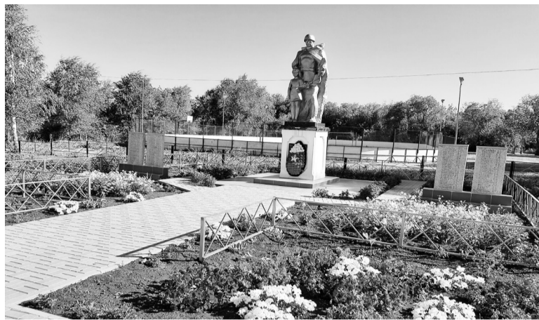
«Аллея Славы» в п. Чапаевский в рамках губернаторского проекта «СОдействие»

В нашем районе с успехом реализуется губернаторский проект «СОдействие», направленный на поддержку социально значимых инициатив жителей региона. Проект «СОдействие» или Государственная региональная программа «Поддержка инициатив населения муниципальных образований в Самарской области» рассчитана до 2025 года. Она направлена на вовлечение жителей городов и районов в развитие своих территорий, ведь лучше них никто не знает, что именно необходимо скорректировать или исправить в первую очередь.