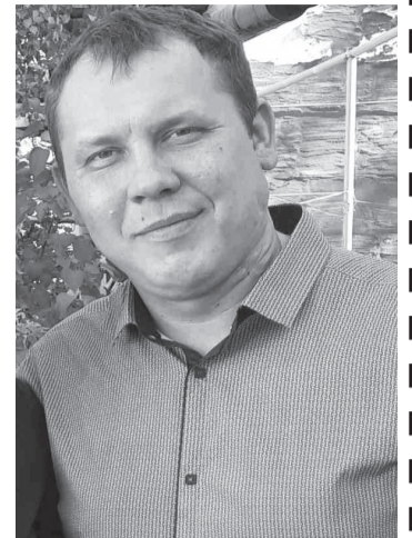
От родителей, жены и сына.

Тебе сегодня 35! От всего сердца поздравляем! Прекрасный, чудный юбилей, Любви и радости желаем. Достиг ты множество высот, Достоин лучших ты наград. И в этот день тебя поздравить, Сегодня каждый будет рад!