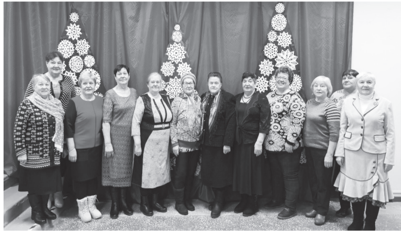
С уважением, участники вокального ансамбля «Рябинушка» Куйбышевского Дома культуры.