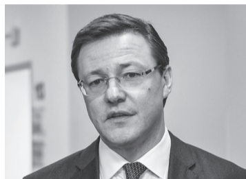
ДМИТРИЙ АЗАРОВ, губернатор Самарской области:

Проект межвузовского кампуса Самарской области на