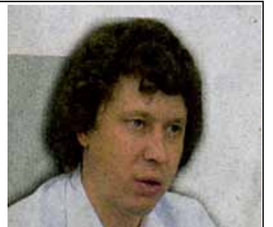
Сергей Крайнев, министр энергетики и ЖКХ:

- Очень важно, что поднята проблема неплатежей УК и собственников. По итогам совещания было рекомендовано изучить механизм заключения прямых договоров собственников с поставщиками коммунальных услуг. Кроме того, было решено внести изменения в областные целевые программы по установке приборов учета. До 2015 г. планировалось выделить из бюджета на эти цели 4,1 млрд. рублей. Теперь же как можно больший объем этих средств поступит в следующем году, чтобы установить максимально возможное количество приборов учета.